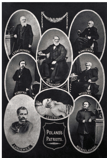
II. 1. Tableau „Poland’s Patriots”, autor nieznanym, b.d.