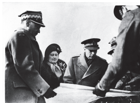
II. 4. Gen. W. Sikorski przedstawia królowi Jerzemu VI z królową Elżbietą plany obrony Anglii, 1940