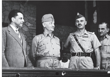
II. 6. Pamiątkowe [ostatnie] zdjęcie gen. W. Sikorskiego, gen. W. Andersa, gen. T. Klimeckiego przed lotem z Egiptu do Gibraltaru, 1940