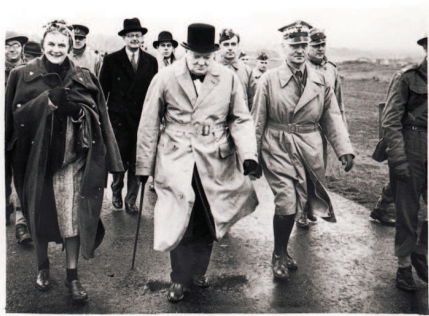
II. 5. Premier W. Churchill podczas inspekcji polskich oddziałów w Szkocji, 1940