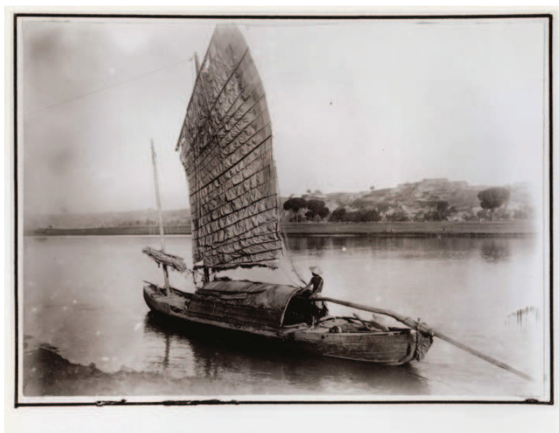
II. 10. Dżonka na rzece Luo, 1906–1909