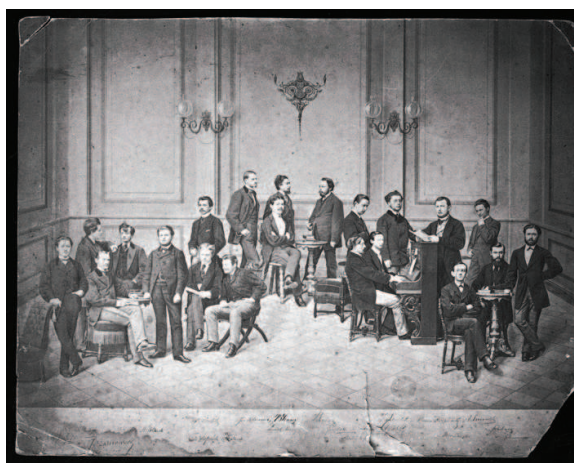
II. 2. Tableau z nieznanymi postaciami, fotomontaż, lata 60. XIX w.