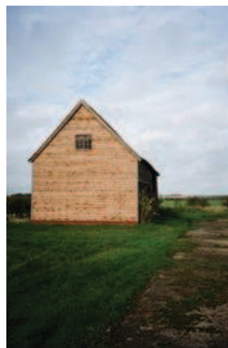
Zdjęcie 7 i 8. „Stodoła” na lotnisku Tempsford – miejsce ostatnich odpraw (przed lotem) spadochroniarzy