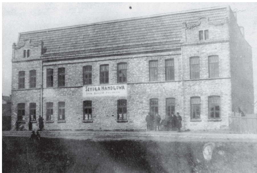
Fot. 1. Budynek Szkoły Handlowej w 1921/22 r.