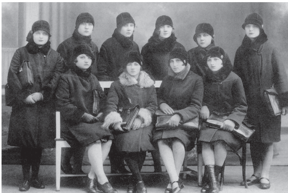
Fot. 2. Uczennice Szkoły Handlowej – okres międzywojenny