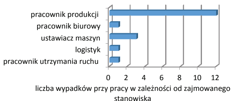
Rys. 1. Liczba wypadków przy pracy w przedsiębiorstwie, którym ulegli pracownicy w roku 2013 w zależności od zajmowanego stanowiska (opracowanie własne na podstawie danych z Firmy ROSA Europe)

Pracownicy przedsiębiorstwa w 2013 roku doznali następujących urazów: