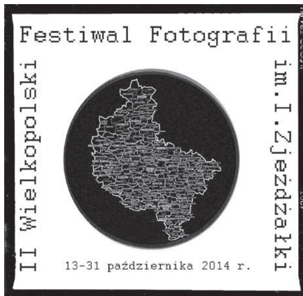
2. Logo Festiwalu