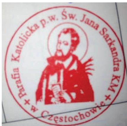
Fot. 3. Pieczęć Parafii św. Jana Sarkandra

Półpostać mężczyzny z brodą 89 , zwrócona w lewo, trzymającego w rękach książeczkę i gałązkę palmową. Nad głową aureola. Na obrzeżu pojedynczy okrąg.