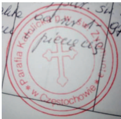
Fot. 4. Pieczęć Parafii św. Zygmunta

Krzyż łaciński okonturowany z treflowymi zakończeniami ramion. Na obrzeżu podwójny okrag. Trzeci okrag pomiędzy napisem otokowym a krzyżem.