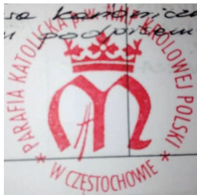
Fot. 1. Pieczęć Parafii NMP Królowej Polski

Stylizowana litera M z koroną. Wewnątrz litery, po lewej stronie – blizny jak na obliczu Maryi z obrazu jasnogórskiego. Brak okręgu na obrzeżu.