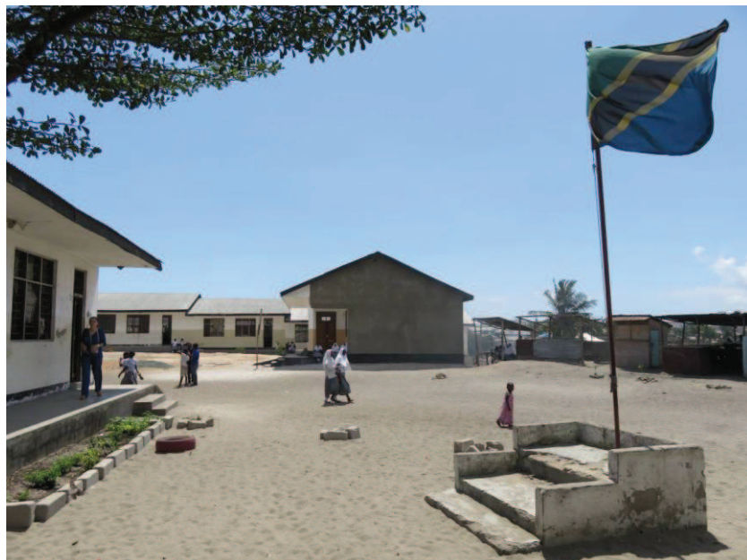
Fot. 1. Typowe podwórko szkolne i otaczające je budynki Mlimani Primary School