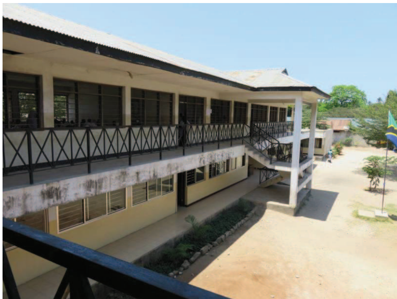
Fot. 3. Typowe podwórko i budynki szkolne Kinondoni Secondary School