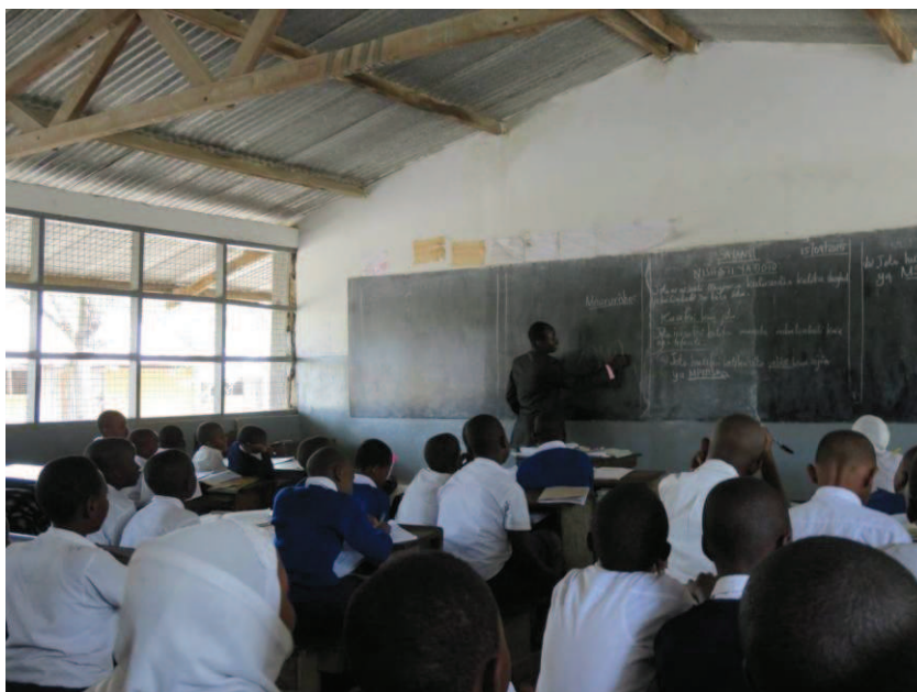
Fot. 2. Klasa szkolna podczas lekcji w Primary School of Education Dar es Salaam University