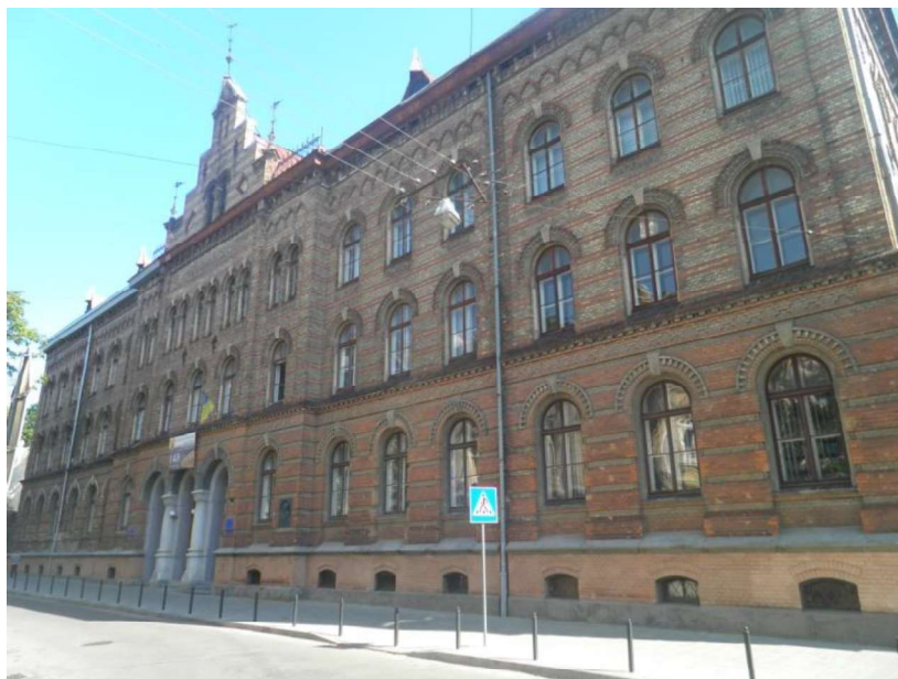
Fot. 2. Budynek pedagogium – dziś siedziba Instytutu Pedagogiki Uniwersytetu im. Iwana Franki we Lwowie (lipiec 2017)