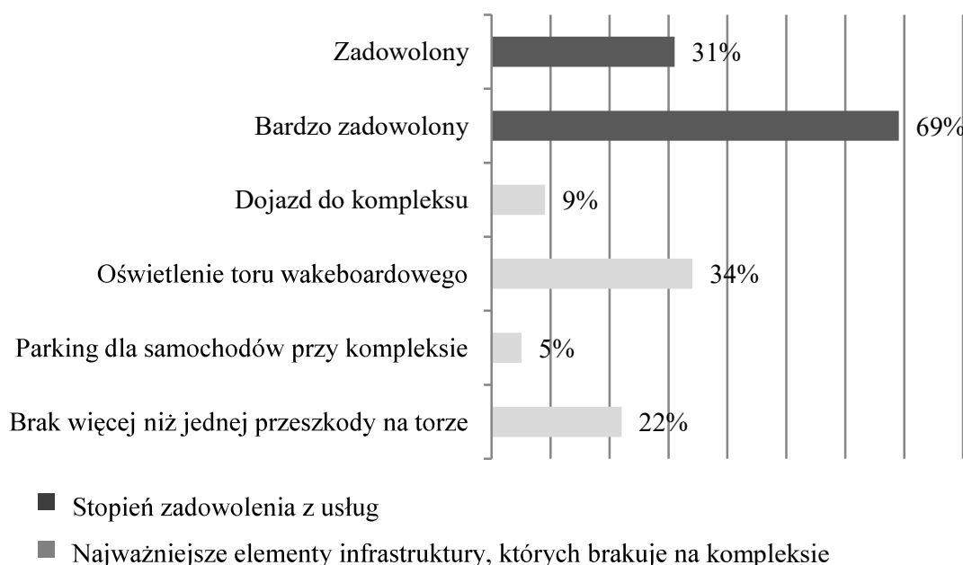
Wykres 2. Poziom zadowolonia klientów oraz wskazania odnośnie do brakujących elementów infrastruktury/zagospodarowania kompleksu w Żółtańcach

kreślają jego fachowość, co przekłada się na stopień ogólnego zadowolenia z usług oferowanych w kompleksie – 69% jest bardzo zadowolonych, a 31% zadowolonych z jakości obsługi (wykres 2).