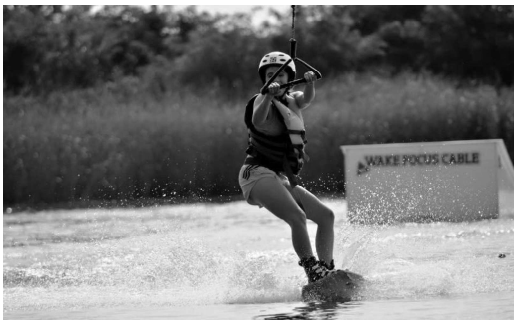
Fot. 1. Korzystająca z wakeboardingu na zbiorniku w Żółtańcach