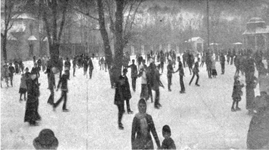
Fot. 2. Festyn łyżwiarski w Oleandrach w Krakowie w 1914 r., źródło: „Nowości Illustrowane” 1914, nr 4, s. 4.

tlumy zwolenników sportu łyżwiarskiego. Na wiosnę tego roku teren Oleandrów przejęła Wisła i urządziła tam boisko piłkarskie 14 .