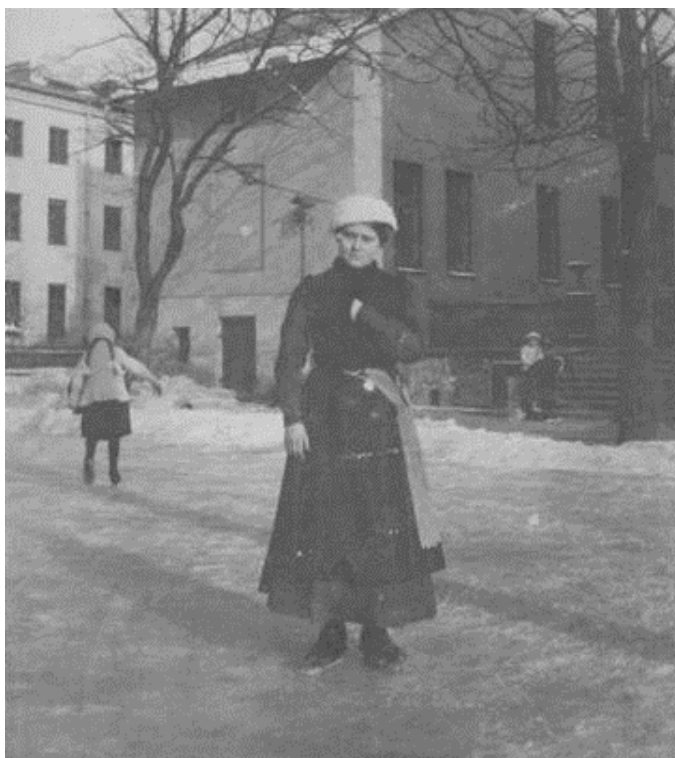
Fot. 3. Kobieta na łyżwach w Limanowej, zdjęcie autorstwa Klementyny Zubrzyckiej-Bączkowiej z lat 1906–1914, źródło: Muzeum Historii Fotografii w Krakowie, sygn. MHF 27768/II.

Którym zaledwie kilka tygodni udało się wykraść zimie na swój użytek 45 .