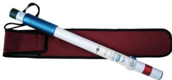
Rys. 2. Detektor AC HotStrick [9]