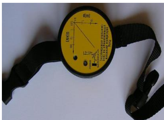
Rys. 4. Detektor DPPE-1 [11]

Bezdotykowy Detektor Prądu AC umożliwiającą wykrycie źródła prądu z bezpiecznej odległości. Sposób sygnalizowania zbliżony jest do ww. detektora AC HotStick, tzn. z wyprzedzeniem wydawane są ostrzeżenia dźwiękowe oraz dodatkowo poprzez migającą diodę LED bez potrzeby dotykania powierzchni, która jest pod napięciem. Ostrzegawczy sygnał dźwiękowy oraz migająca dioda LED zwiększają swoją siłę i częstotliwość wraz ze zbliżaniem się do źródła napięcia. Detektor FireCraft trACer jest urządzeniem wodoodpornym i posiadającym wzmocnioną obudowę. W porównaniu do AC HotSticka, jego kształt i gabaryty umożliwiają schowanie urządzenia w kieszeni. Do wad należy zaliczyć brak możliwości zmiany czułości pracy [10].