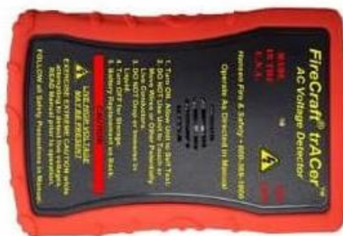
Rys. 3. Detektor Fireraft trACer [10]

Bezdotykowy Detektor Prądu AC umożliwiającą wykrycie źródła prądu z bezpiecznej odległości. Sposób sygnalizowania zbliżony jest do ww. detektora AC HotStick, tzn. z wyprzedzeniem wydawane są ostrzeżenia dźwiękowe oraz dodatkowo poprzez migającą diodę LED bez potrzeby dotykania powierzchni, która jest pod napięciem. Ostrzegawczy sygnał dźwiękowy oraz migająca dioda LED zwiększają swoją siłę i częstotliwość wraz ze zbliżaniem się do źródła napięcia. Detektor FireCraft trACer jest urządzeniem wodoodpornym i posiadającym wzmocnioną obudowę. W porównaniu do AC HotSticka, jego kształt i gabaryty umożliwiają schowanie urządzenia w kieszeni. Do wad należy zaliczyć brak możliwości zmiany czułości pracy [10].