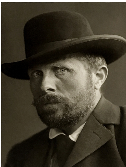
1. Portret Jeana Paara, 1914 r., 15,5×10,5 cm, w zbiorach w Berlinie: Staatsbibliothek und Berlin-Preussischer Kulturbesitz