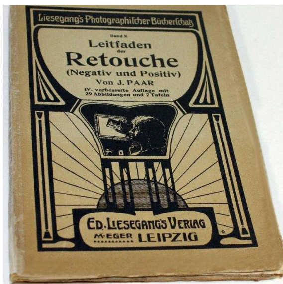
3. Okładka książki o retuszu Leitfaden der Retouche für Negativ und Positiv (Przewodnik retuszu negatywów i pozytywów), wyd. IV, Leipzig 1909.