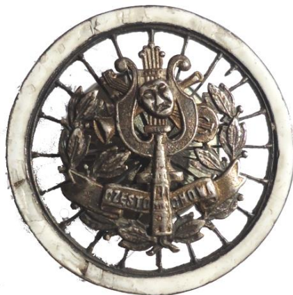
Fot. 6. Odznaka Towarzystwa Cyklistów „Lutni”

Cykliści posiadali własną odznakę wykonaną także przez Lucjusza Cyganowskiego, charakteryzującą się tym, że podstawowa jej wersja została umieszczona na emaliowanym na biało ażurowym kole rowerowym (fot. 6 i 7).