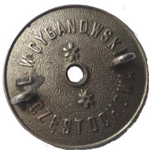
Fot. 7. Nakrętka stosowana do odznaki cyklistów i honorowej