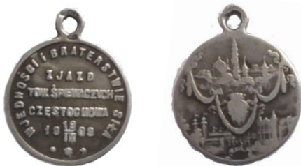
Fot. 8. Medalik nieformalnego Zjazdu Stowarzyszeń Śpiewaczych w 1909 roku w Częstochowie