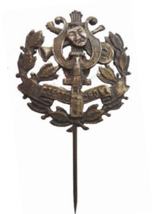
Fot. 5. Wersja podstawowa odznaki „Lutni”