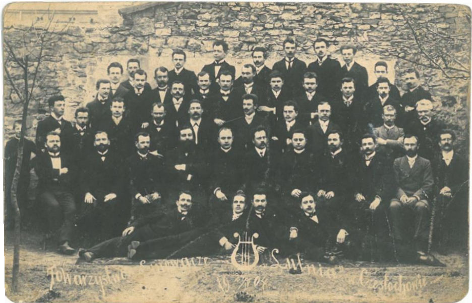
Fot. 1. Towarzystwo Śpiewacze „Lutnia” w Częstochowie, 24.04.1904 rok

Na przełomie XIX i XX wieku w Częstochowie grupa miejscowej inteligencji podjęła starania mające na celu powołaniu stowarzyszenia śpiewaczego „Lutnia”.