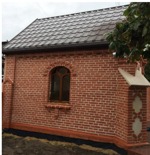
Fot. 5. Lewa strona kapliczki po oczyszczeniu i wymianie okna