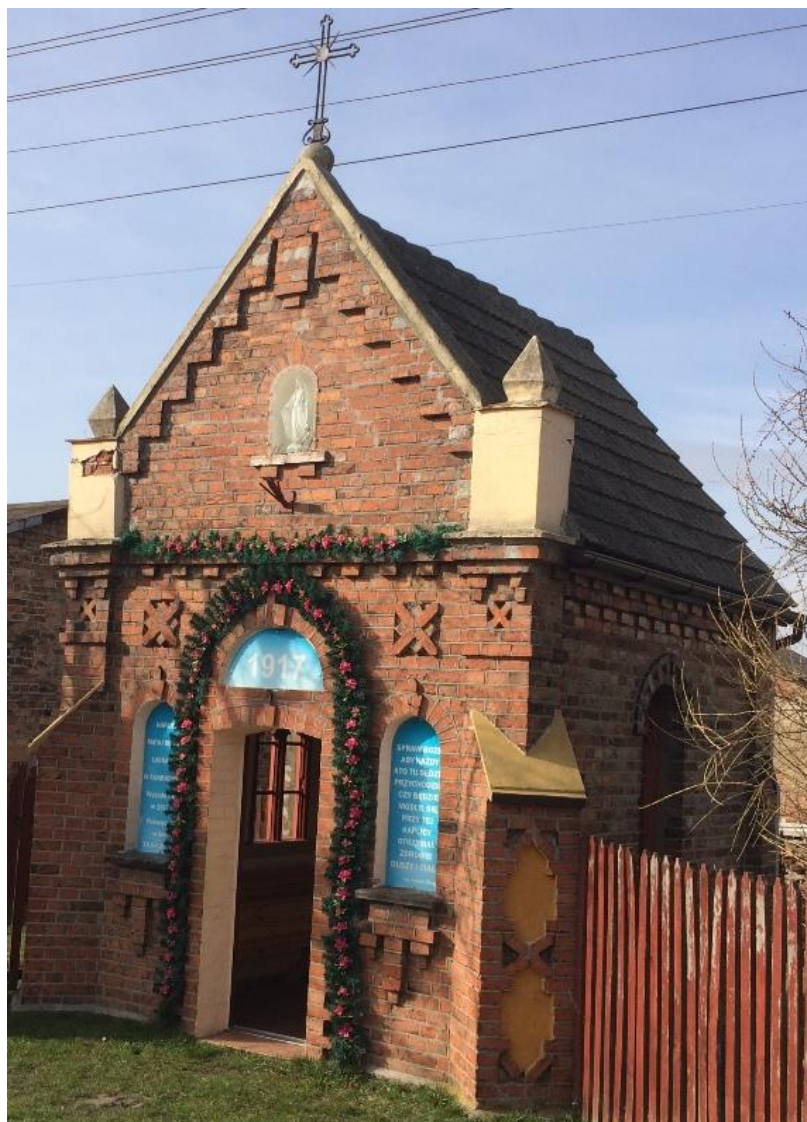
Fot. 2. Prząd kapliczki przed remontem

tablic zainstalowano nowe ozdobne tablice wykonane z piaskowca. Dodatkowo zainstalowano instalację elektryczną oraz nagłośnienie. Z funduszy parafii Przemienienia Pańskiego w Częstochowie zakupiono nowy ołtarz wraz z krzyżem. Niestety, stary 100-letni krzyż rozpadł się podczas demontażu. Autor artykułu wykonał fotografie przed i po remoncie, niektóre z fotografii dokumentujące restaurację kapliczki zostały zamieszczone poniżej.