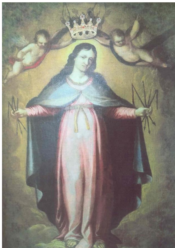
Fot. 8. Obraz Matki Bożej Łaskawej.