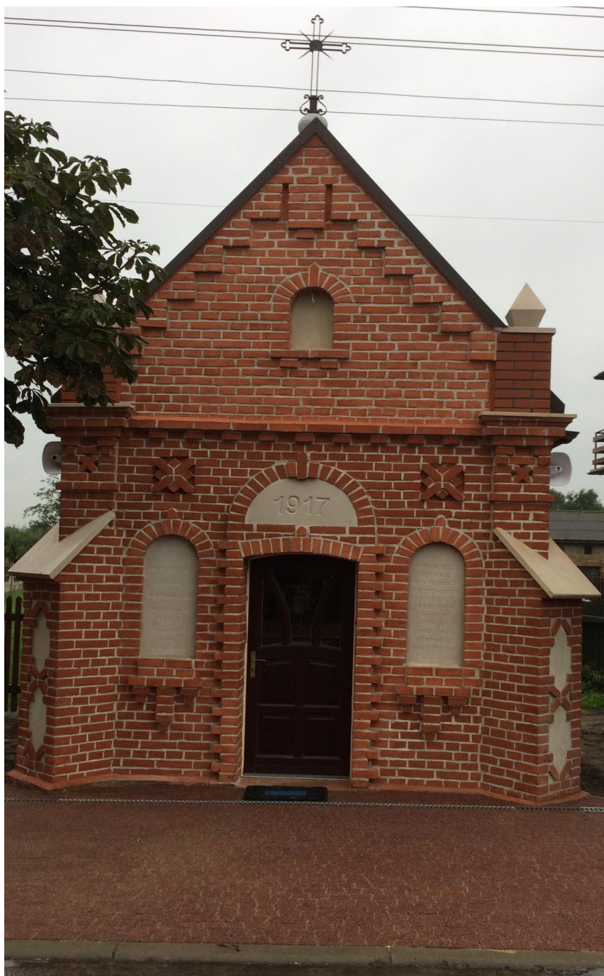
Fot. 3. Przód kapliczki po oczyszczeniu i ułożeniu kostki brukowej