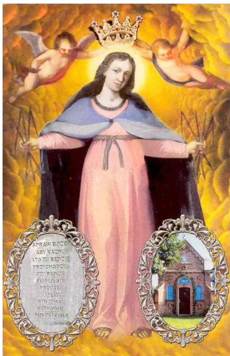
100-lecie Kaplicy w Konradowie 1917-2017

czystość poświęcenia kapliczki wraz z oficjalnym nadaniem jej patronki Matki Boskiej Łaskawej w dniu 20.04.2008 roku. Warto nadmienić, iż mieszkańcy Konradowa wyszli z inicjatywą założenia kroniki kapliczki dopiero w 2017 roku, na 100-lecie jej istnienia. Kronika ta posłuży przyszłym pokoleniom do dokumentacji dziejów obiektu oraz ważniejszych uroczystości, takich jak ta na jej 100-lecie istnienia, podczas której dokonali wpisu: ksiądz arcybiskup wraz księdzem proboszczem, wóldarze gminy oraz wszyscy obecni na uroczystości.