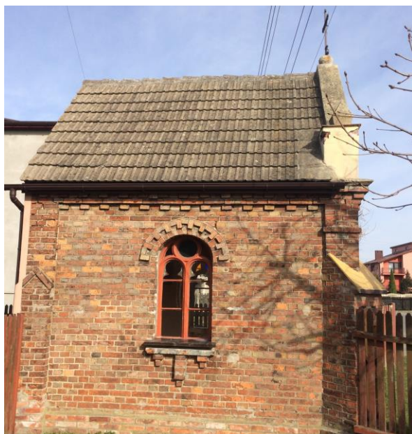
Fot. 4. Lewa strona kapliczki przed remontem