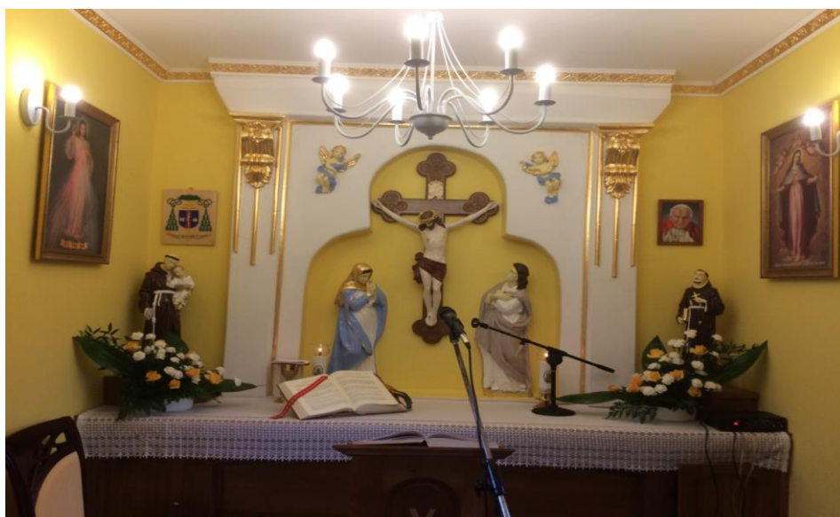
Fot. 7. Wnętrze kapliczki po remoncie