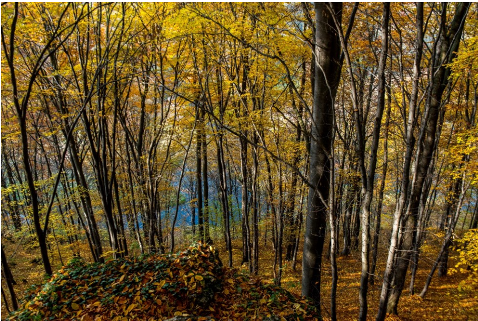
Gąszczyk jesienią – widok na starorzecze Warty