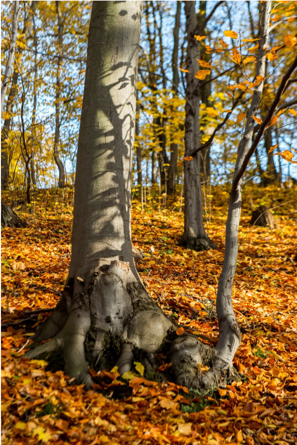
Gąsczyk jesienią – ciekawy układ korzeniowy na stoku