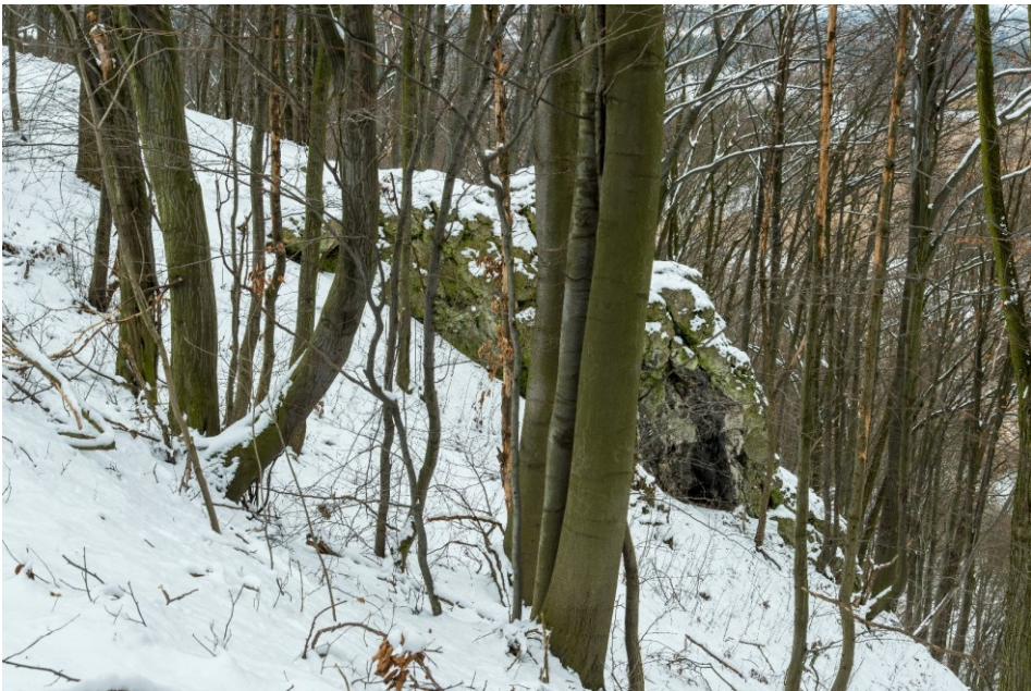
Gąszczyk zimą – wychodnia skalna