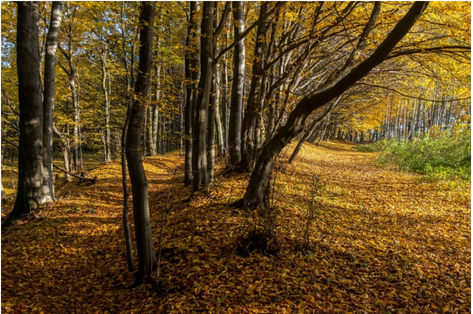
Gąszczyk jesienią – las na wale