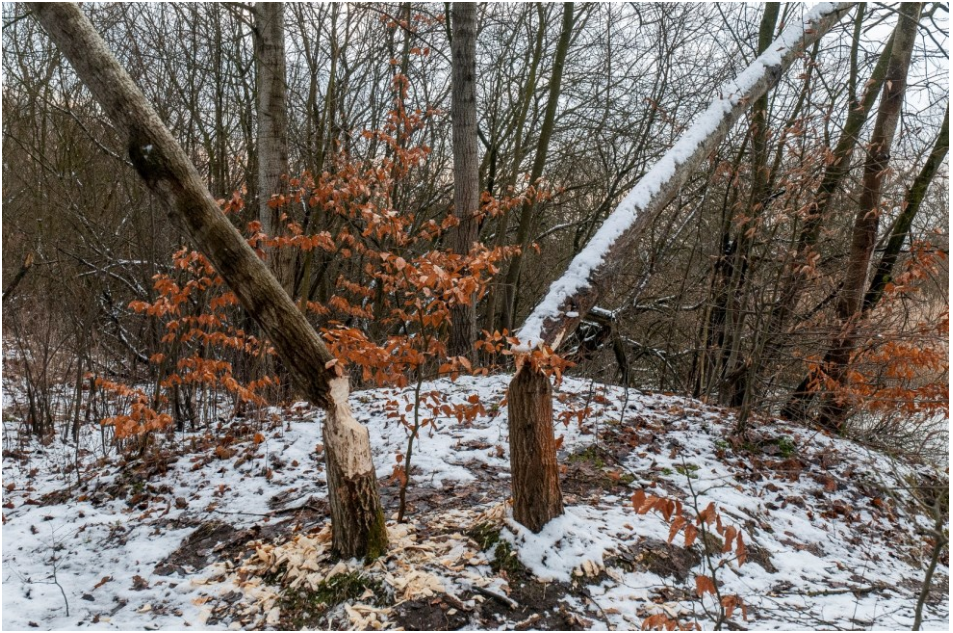
Gąszczyk zimą – bobrowe ślady