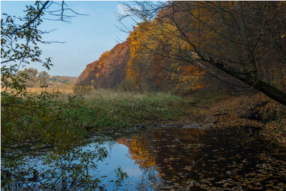
Gąszczyk jesienią – starorzecze Warty