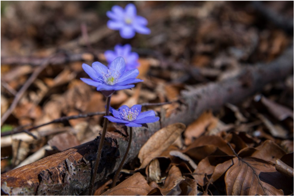
Gąszczyk wiosną – pierwsze kwiaty