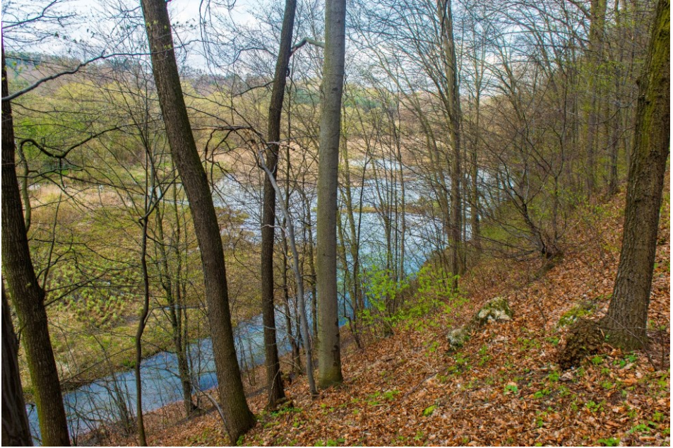
Gąszczyk wiosną – widok na starorzecze Warty