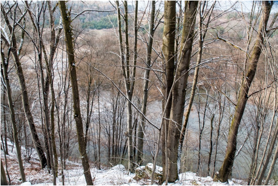
Gąszczyk zimą – widok na starorzecze Warty