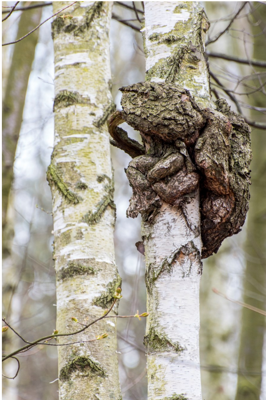
Gąszczyk wiosną – narośl na brzozie