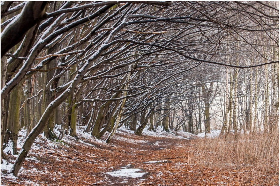
Gąszczyk zimą – las na wale