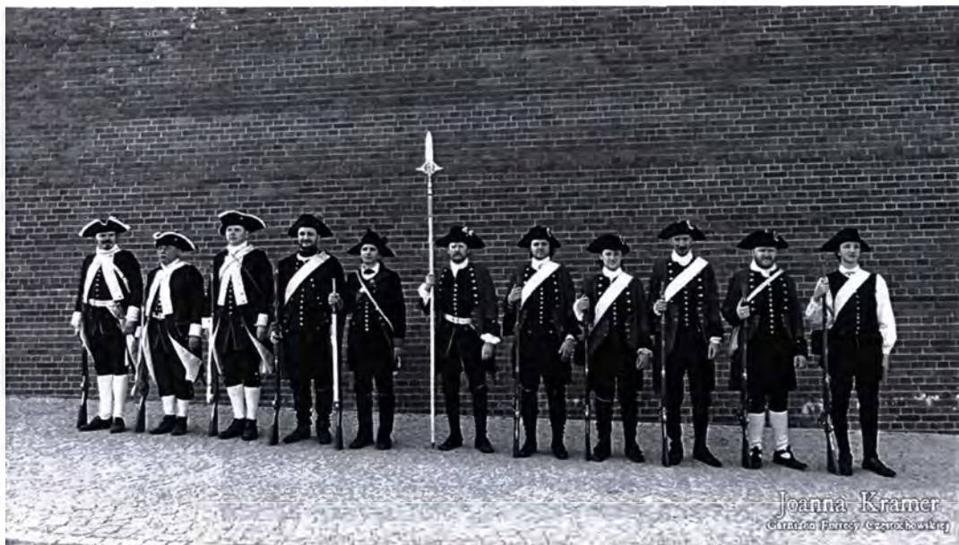
Uczestnicy biwaku historycznego

Pozanaukowym celem spotkania było rozbudzenie wśród młodzieży zainteresowania historią, a zwłaszcza małym znanym okresem XVIII wieku. W związku z tym zaplanowano imprezę towarzyszącą – inscenizację biwaku