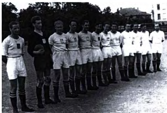
Szczypiorniści (1948)