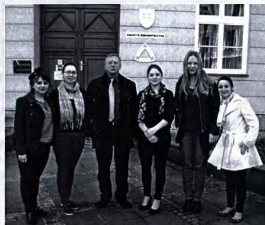
Przedstawiciele AJD na konkursie muzycznym w Rużomberku

Kolejny raz nasi studenci są zauważani i nagradzani przez międzynarodowe jury konkursu w Rużomberku. Młodym Artystom oraz ich Pedagogom serdecznie gratulujemy i życzymy dalszych sukcesów!