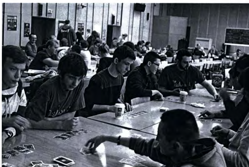
Sympatycy planszówek i karcianek podczas IX Twierdzy.