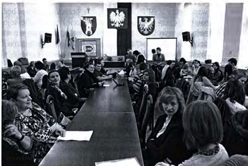
Uczestnicy konferencji

Pragną, by spotkanie było przyczynkiem do integracji różnych perspektyw naukowych, sektorowych (pomocy i integracji społecznej, zatrudnienia, edukacji) oraz praktycznych - środowiskowych.