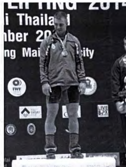
Mistrz Świata Łukasz Grela