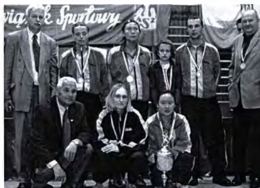
Wicemistrzyni Polski w tenisie stołowym (2005)