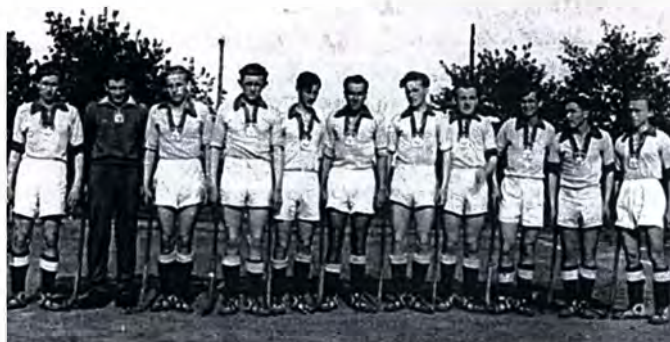
Hokeiści na trawie AZS (I liga-1956), fot.: arch.